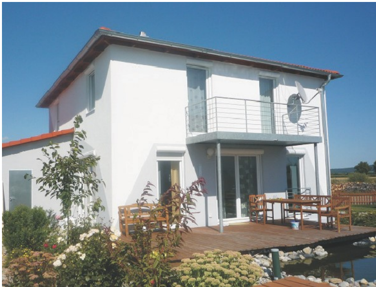
Abb. zeigt Sonderwünsche