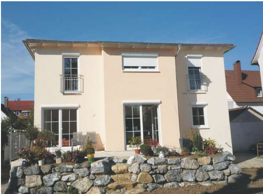
Abb. zeigt Sonderwünsche