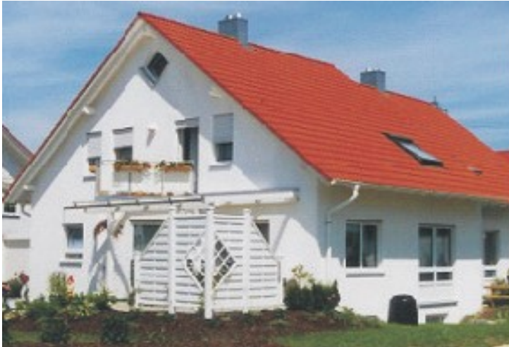
Abb. zeigt Sonderwünsche