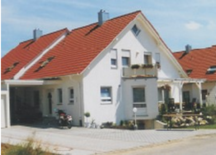
Abb. zeigt Sonderwünsche