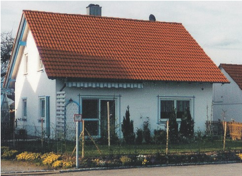
Abb. zeigt Sonderwünsche